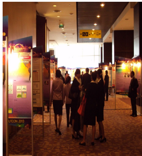
การนำเสนอในงานประชุม 5th RMUTNC